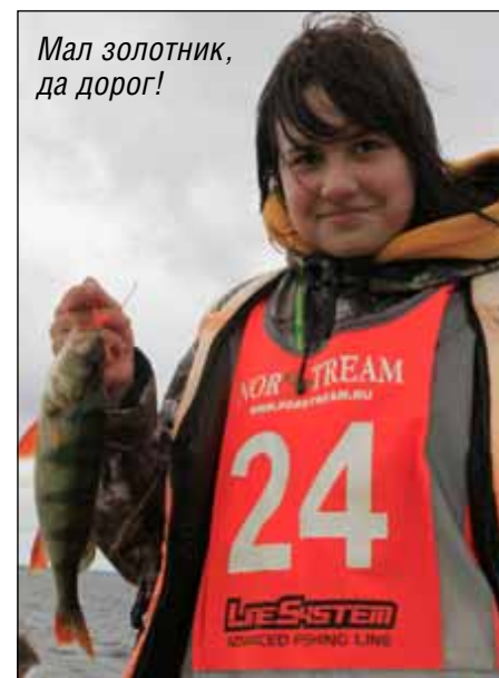
Мал золотник, да дорог!