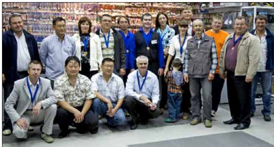
Фото: А. Белов (2)

Надеемся, фидерный фестиваль станет для хабаровских рыбаков доброй традицией.