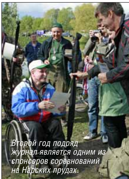
Второй год подряд журнал является одним из спонсоров соревнований на Нарских прудах.