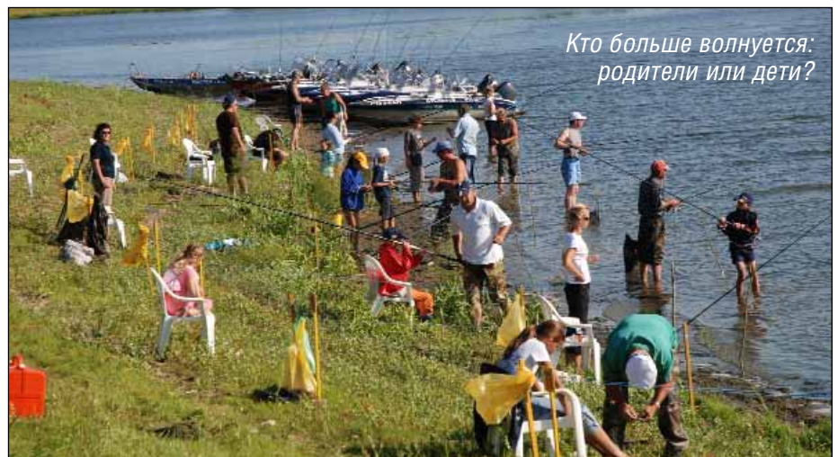
Кто больше волнуется: родители или дети?

Стало уже доброй традицией проведение соревнований по ловле спиннингом на Кубок губернатора Ивановской области в замечательном городе Юрьеvec. В прошлом году он проводился в середине сентября. Несмотря на кризис, в результате которого заметно сократилось число участников, здесь тоже собрались